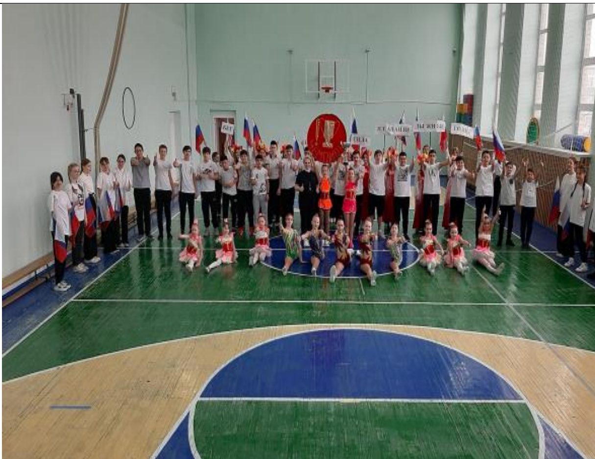
Фото школьного спортивного клуба «Чемпион»